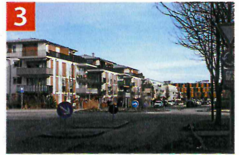
3 Kreisverkehr Mühlfeldweg/Prof.-Angermair-Ring