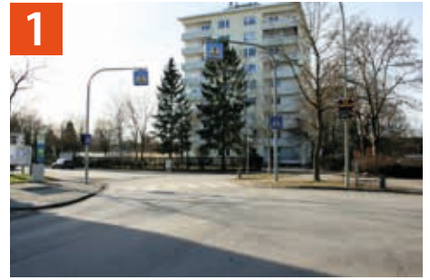
Einsteinstraße / Maier-Leibnitz-Straße