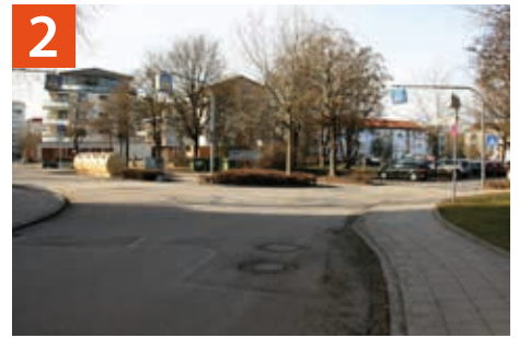
Niels-Bohr-Straße / Telschowstraße