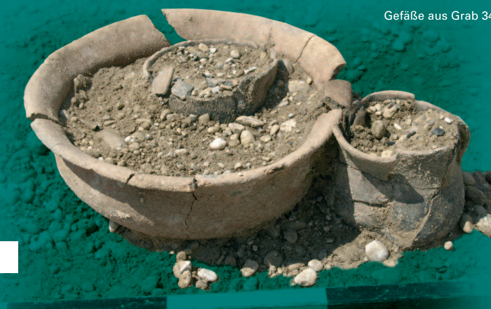
Gefäße aus Grab 34

Im Jahre 2006 grub die Firma SingulArch auf dem benachbarten Grundstück (heute Lidl) Gräber der älteren Hügelgräber-Bronzezeit (um 1500 v.Chr.) aus, am Prof.-Angermair-Ring eine frühmittelalterliche Siedlung (um 600 n.Chr.).