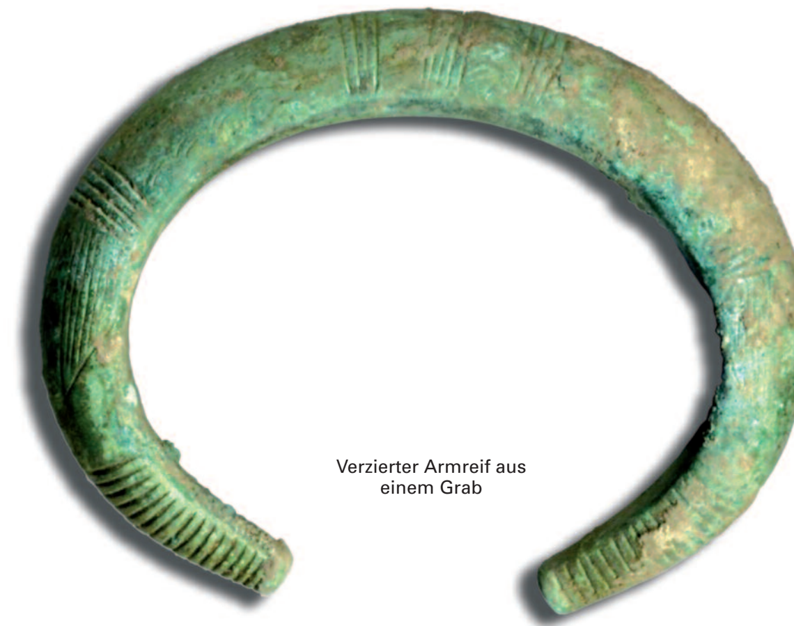
Verzierter Armreif aus einem Grab