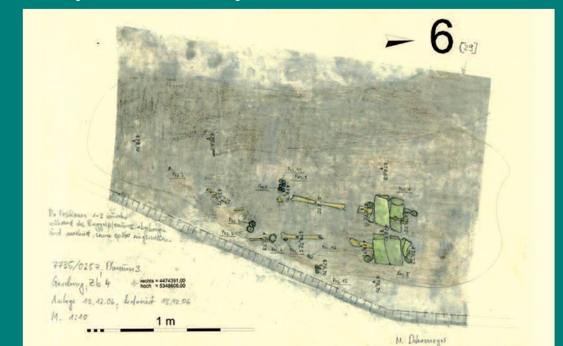
Zeichnung Grab mit Knochen und Beigaben

Das Hügelgräberfeld gehörte offenbar zu einer Siedlung, die sich weiter südlich im bebauten Ortsgebiet Garchings befand. Ein kleiner quadratischer Pfostenbau diente wohl als Zugang zu diesem Friedhof. Besonders wertvoll sind die selten so gut erhaltenen Beinbergen, die eine vornehme Frau um ihre Unterschenkel getragen hatte, möglicherweise über einem Textil. Gut erhaltene Grabhügel der Bronzezeit sind heute noch im Naturschutzgebiet „Garchinger Heide“ zwischen Dietersheim und Eching zu sehen.