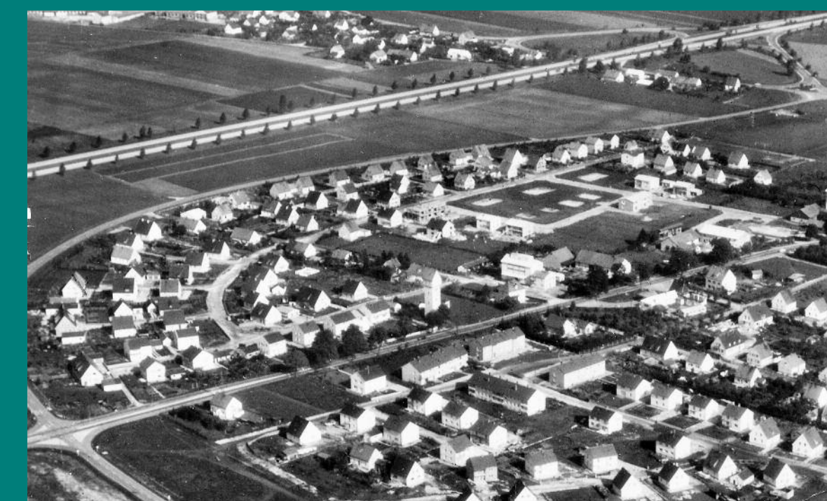
Luftbild Garching um 1960 von Südost: unten die Neumeyr-Siedlung, Mitte die Wasserturm- und Postsiedlung mit Wasserturm, Raiffeisen-Lagerhaus und Tankstelle, oben die Autobahnsiedlung (gebaut ab 1935). Umgehungsstraße B 471 zur Salzburger Autobahn.

denen einfache „Spitzgiebelhäuser“ errichtet wurden, oft von den Bewohnern selbst. In den letzten Jahren wurden viele der Grundstücke dichter oder neu bebaut.