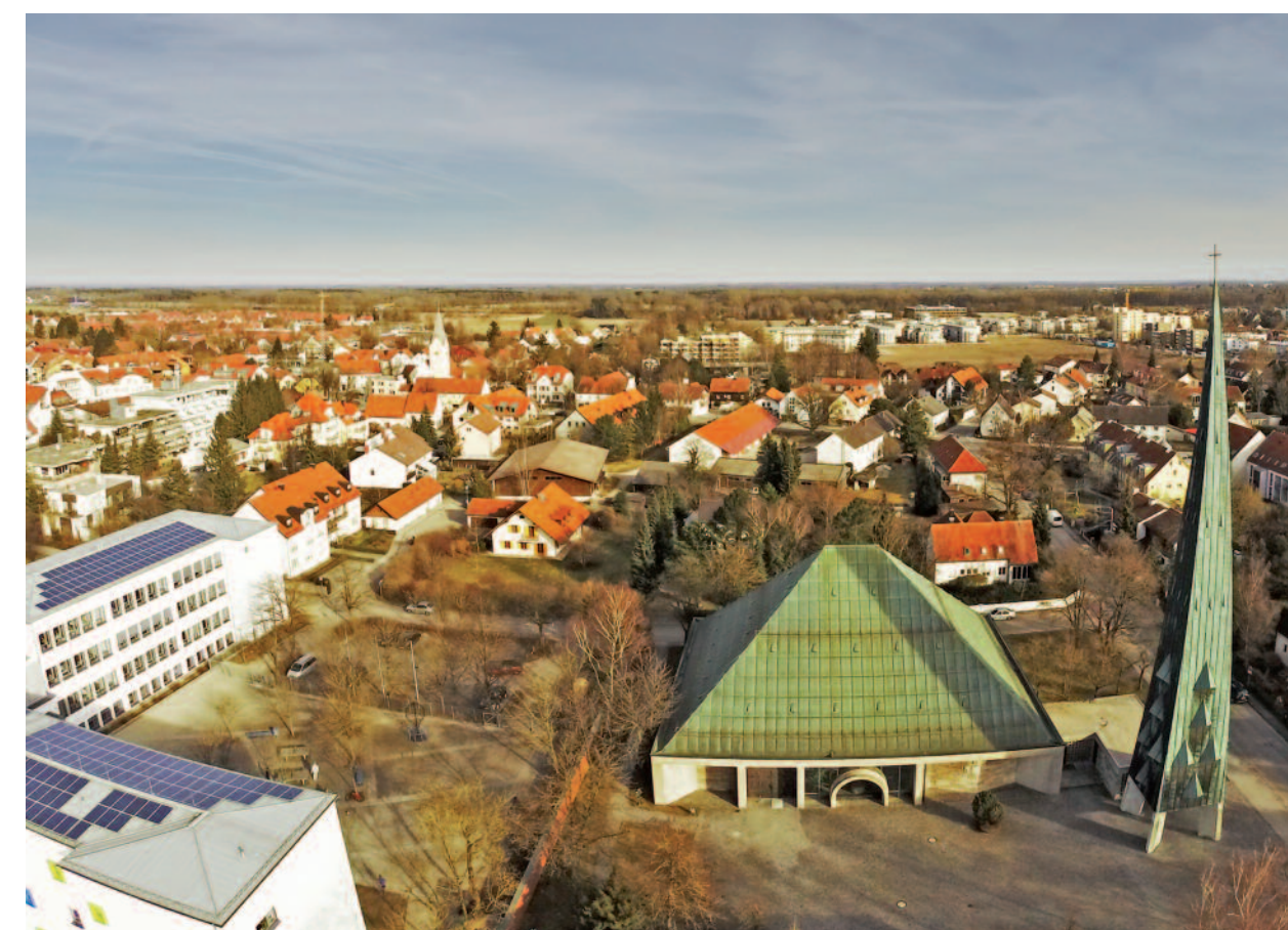
Luftbild von Westen: Kirche und Schulen St. Severin bzw. Garching-West. Hinten links die alte Pfarrkirche St. Katharina, hinten Mitte Werner-Heisenberg-Gymnasium und Grundschule Garching-Ost.