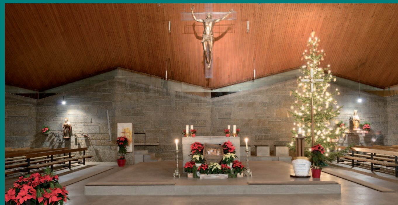
Altarraum mit Kreuz. Hinten links Statue des Hl. Severin.

Der heilige Severin von Noricum, der namengebende Patron der neuen Kirche, war wohl ein hoher römischer Beamter, der als Mönch und Glaubensbote in den letzten Jahrzehnten des Römischen Reiches in der Provinz Noricum an der Donau zwischen Passau und Wien lebte und wirkte. Es gelang ihm, zwischen arianischen und römischen Christen zu vermitteln, vor allem aber die christlichen Gemeinden und die Reste der römischen Bevölkerung in den Kämpfen der Völkerwanderung zu schützen und im Glauben zu stärken. Er starb am 8.1.482.